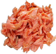
السلم المطبوخ أو المفروم