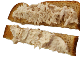
اللحم المهروس على الخبز المحمص