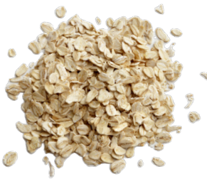
الشوفان أو حبوب الفطور سيريال