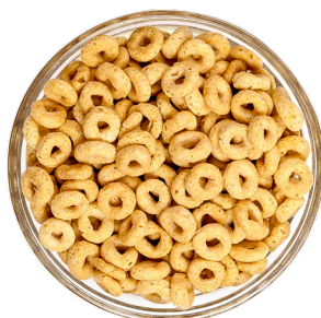
حبوب على شكل دائرة