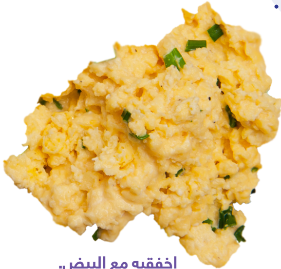
اخفقيه مع البيض.

استخدمي حبوب الفطور سيريال المخصصة الأطفال والفواكه والخضار ومهروسات اللحوم بطرق جديدة. فهي تضيف الفيتامينات والمعادن إلى وجبات عائلتك.