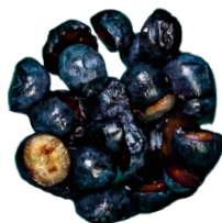
التوت المقطع إلى نصفين