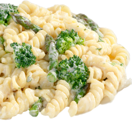
اخلطيه مع المعكرونة.

استخدمي حبوب الفطور سيريال المخصصة الأطفال والفواكه والخضار ومهروسات اللحوم بطرق جديدة. فهي تضيف الفيتامينات والمعادن إلى وجبات عائلتك.